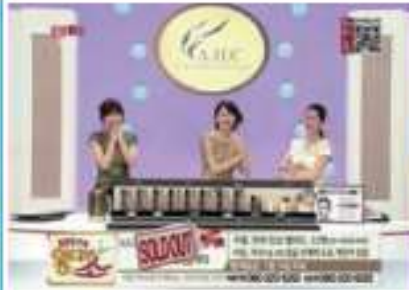
(나) TV 홈쇼핑