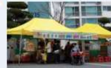
아파트에 열리는 일일 장터

예를 들어 매달 5일, 10일, 15일, 20일, 25일, 30일에 장이 열린다.