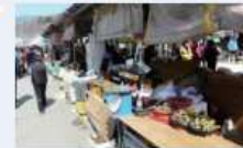
경남 하동군 화개장터