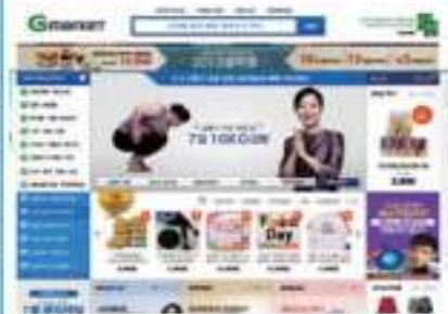
(라) 온라인 쇼핑몰